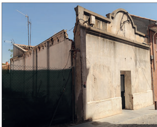
La Casa del Pueblo se encuentra en la calle del Duque de Barajas.

El primero acto de este centenario será la presentación del libro El centenario de la Casa del Pueblo de Barajas (1912-2012) , que tendrá lugar el 13 de junio. El libro se puede ver en la web www.psoe-barajas.org , y en él han colaborado Beatriz Corredor, ex ministra de Vi-