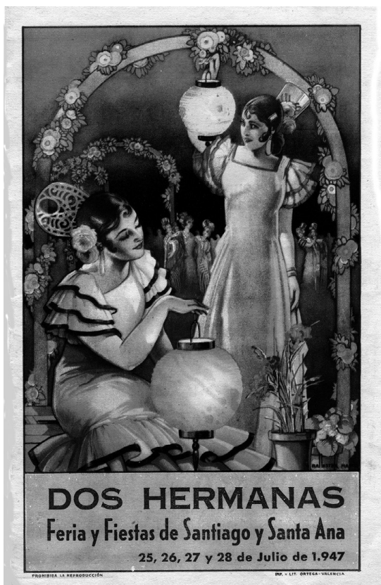
Programa de festejos de 1947