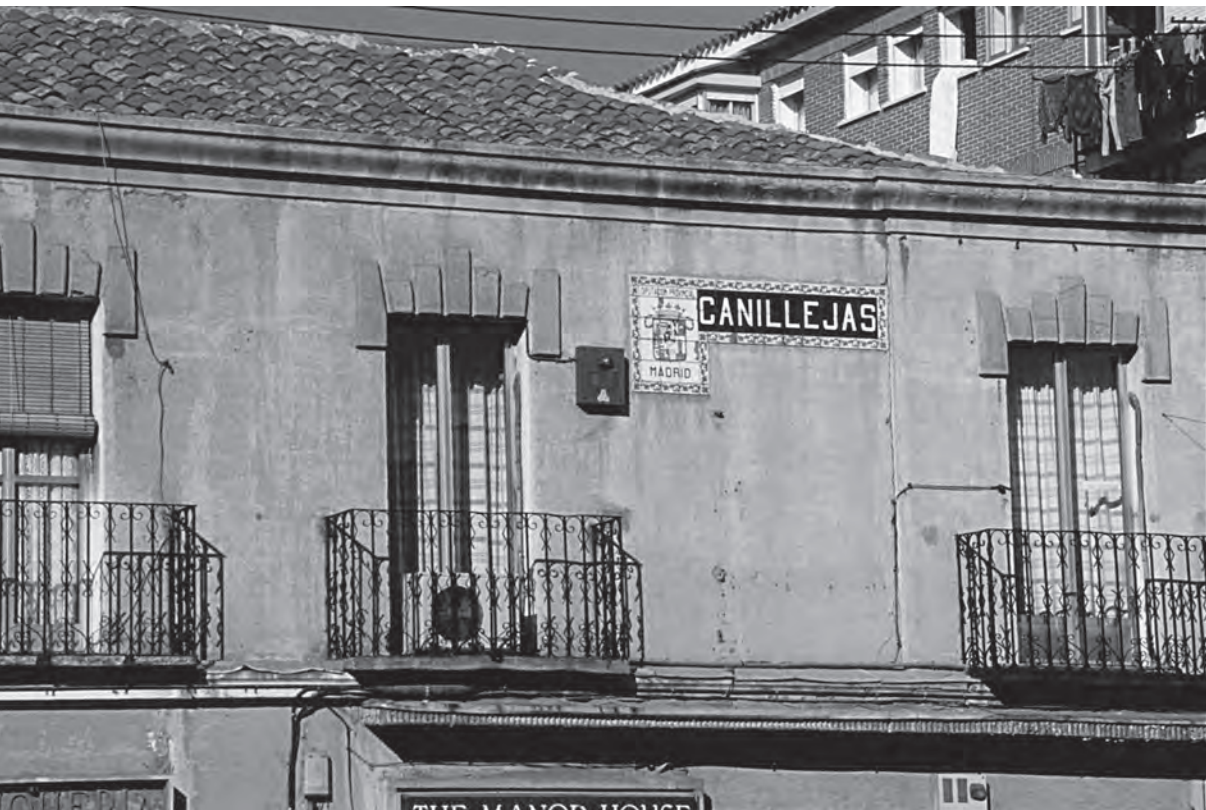
Edificio desaparecido en la calle Alcalá que albergó el escudo de Canillejas cuando Madrid tenía Diputación Provincial. Después se trasladó al antiguo Ayuntamiento en la plaza de la Villa de Canillejas.