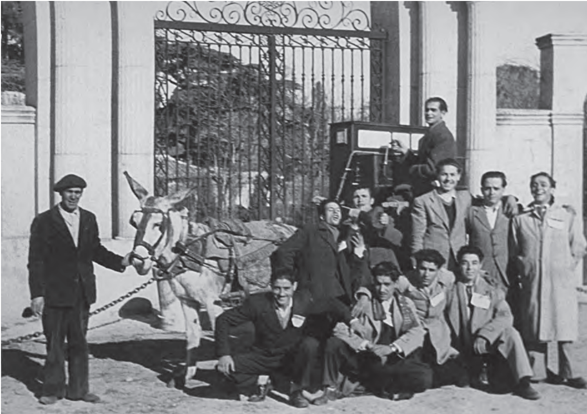
Los quintos de 1949 posan delante de la Quinta de Torre Arias con carro, mula y organillo, que generalmente se alquilaba para celebraciones.